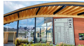
从景德镇到彭州小石村，一个可生长的展览