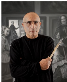
Gabriele di Matteo

加布里埃莱·迪·马特奥（Gabriele di Matteo）为巴塞艺术博览会（Art Basel）无限展（Art Unlimited）创作的“中国，意大利制造”系列画作，源于人们意识到：“几乎不可能为单一的绘画风格申请专利”，因为不可能将与版权有关的主张应用于任何艺术想象中。自从加布里埃莱的艺术生涯开始以来，他就一直在质疑画家在绘画过程中的积极参与应如何与绘画实践本身的动手练习形成密切联系。