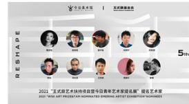
“王式廓艺术扶持项目暨今日青年艺术家提名展”入围名单揭晓